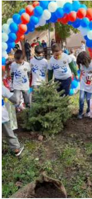
Сађење „Дрвета генерације“